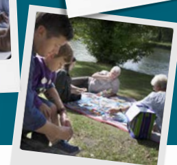
Ses med venner